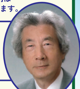
小泉 純一郎 元内閣総理大臣

※それぞれ事前にLINEにてお申し込みになります。当日入場は出来ません。 ※定員を超えた場合は抽選になります。申込締切と抽選結果の発表は、あらかじめLINEでお知らせします。 ※事情により変更または中止する場合がございます。